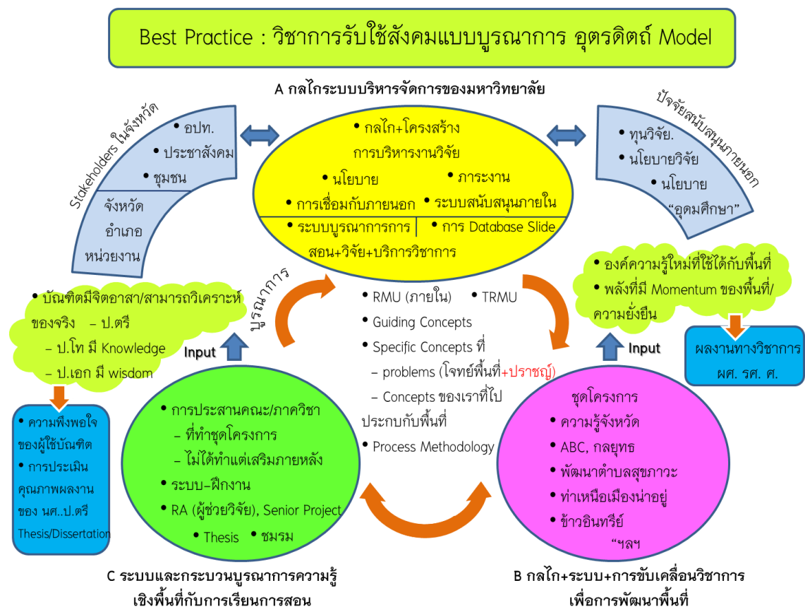
ภาพที่ ๓ รูปธรรมผลงานเด่นวิชาการรับใช้สังคมแบบบูรณาการ(อุดรดิตถ์ Model)